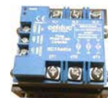
Thyristorsteller 3phasig 400VAC