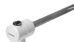
Heizstab 230/400V 3kW - 4,5kW