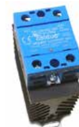
Thyristorstelle 1phasig 230VAC